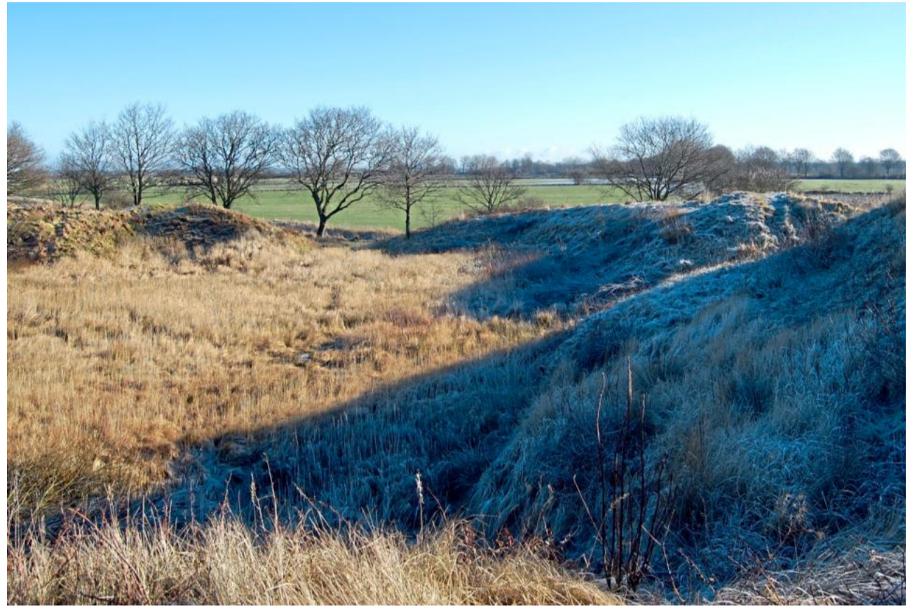
Die Stellerburg in Weddingstedt ist eine frühmittelalterliche Ringwallanlage, die Wälle erheben sich deutlich aus der Landschaft heraus.

In seinem Buch porträtiert Meier wissenschaftlich fundiert und mit zahlreichen Quellen belegt fränkische, sächsische, slawische und friesische Burgen. In Schleswig-Holstein seien die mittelalterlichen Burgen im sächsischen Bereich Nordelbiens zwischen der Elbe auf südlicher Seite und der Eider auf nördlicher